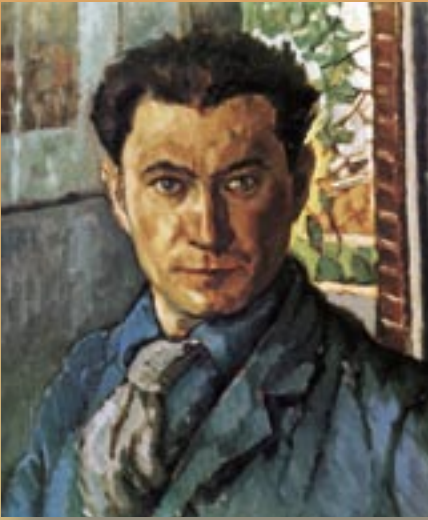
Bo: Selfportret. Olieverf, 1924