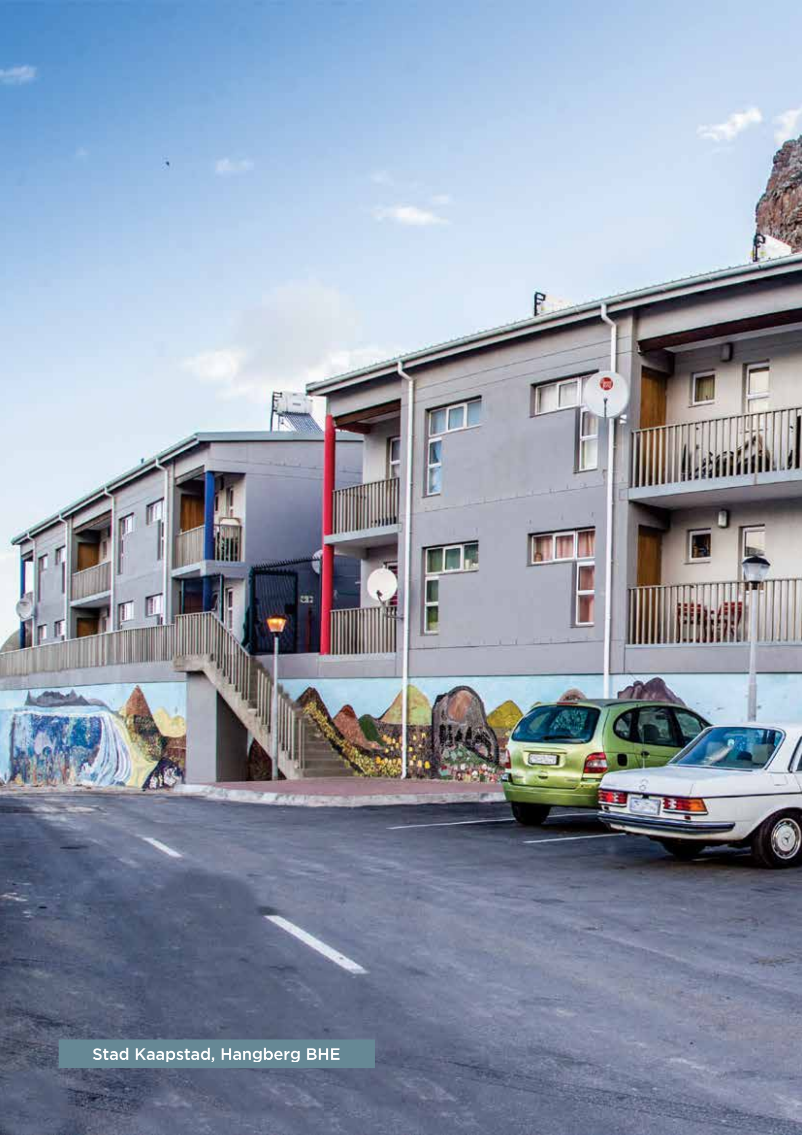
Stad Kaapstad, Hangberg BHE