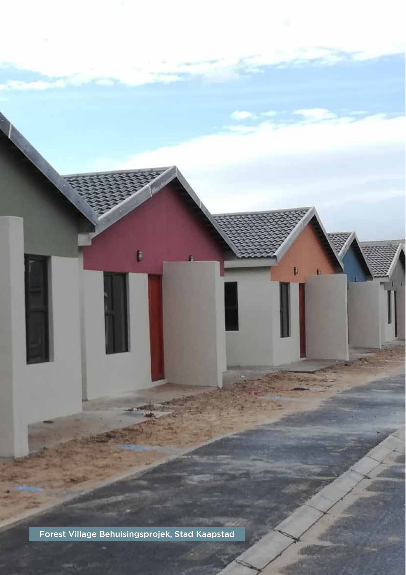
Forest Village Behuisingsprojek, Stad Kaapstad